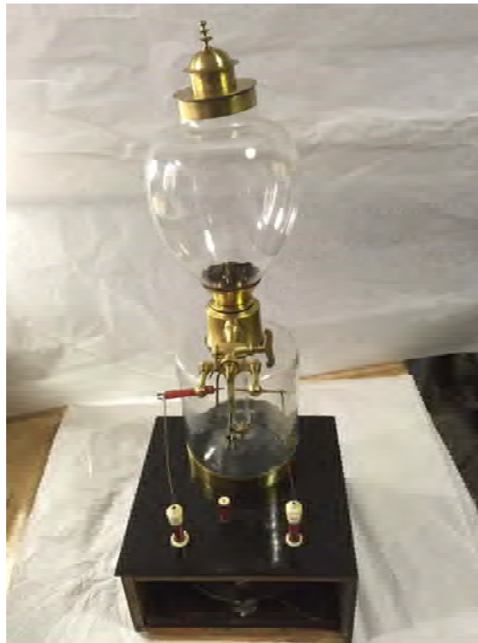
Dopo il restauro