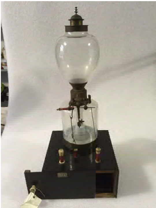
Prima del restauro