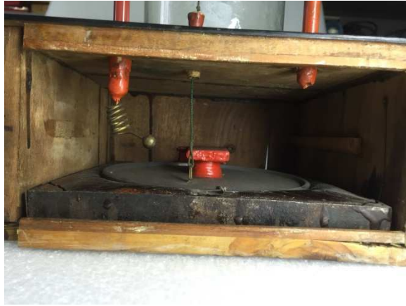
Particolare dell'interno con l'elettroforo