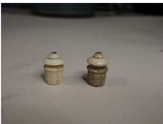
Prima e dopo pulitura elementi avorio