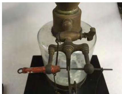
Particolare prima del restauro