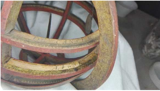
Durante la pulitura