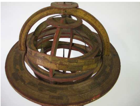
Particolare prima del restauro