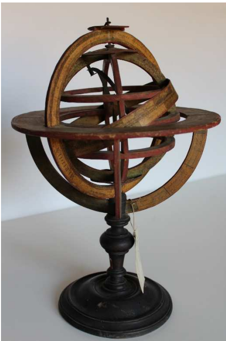
Prima del restauro