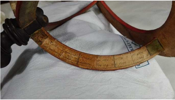
Durante la pulitura