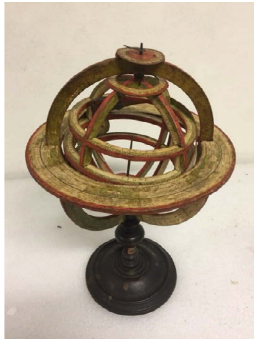
Dopo il restauro